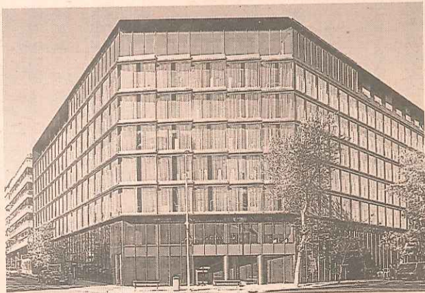
Sede del despacho Cuatrecasas, Gonçalves Pereira en Madrid.

Garrigues. Chambers define a Gómez-Acebo como "un bufete sólido con una presencia nacional muy desarrollada, elogiado por su dedicación y servicio al cliente y un asesoramiento orientado al negocio. En los últimos 12 meses, han destacado sus áreas de cumplimiento normativo y gestión de patrimonios".