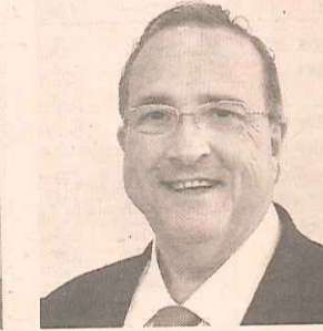
Carles Puig Fiscal y Patrimonios. Cuatrecasas